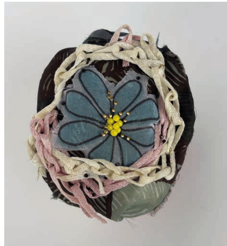
Épingles sur tissu 2026