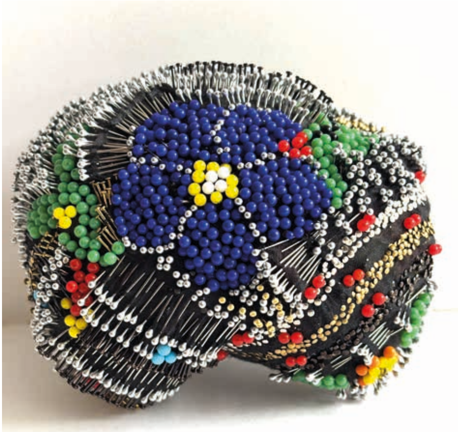
Épingles sur tissus 2026