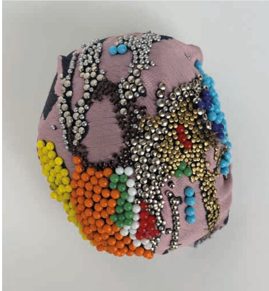
Épingles sur tissu 2026