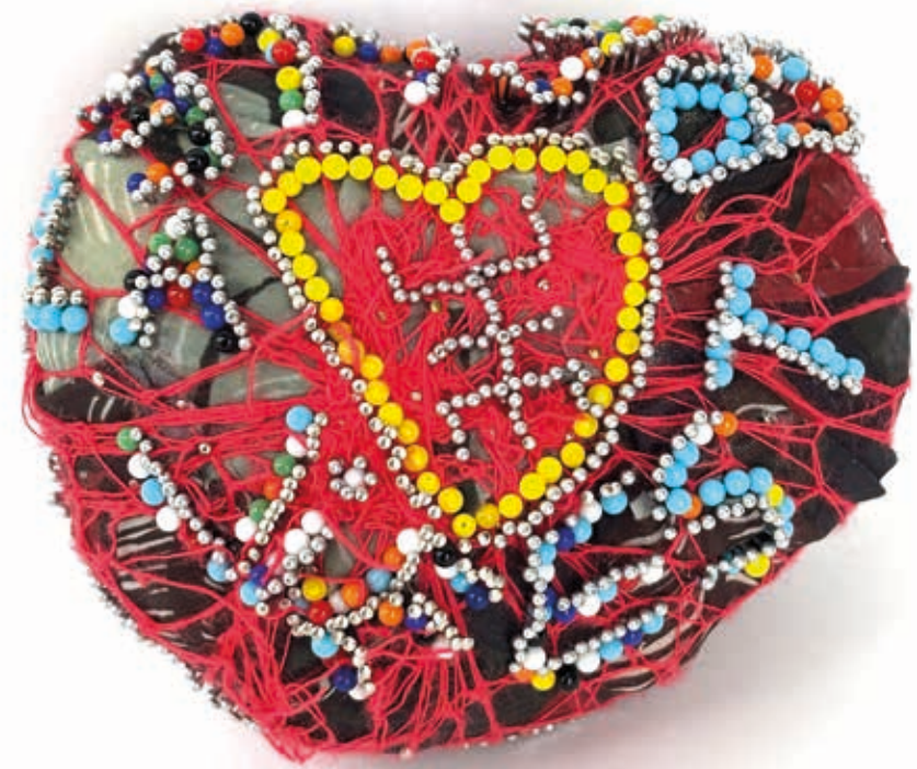
Épingles sur tissus 2026