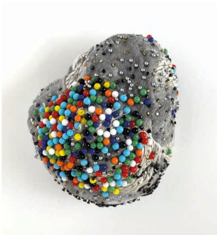
Épingles sur tissu 2026