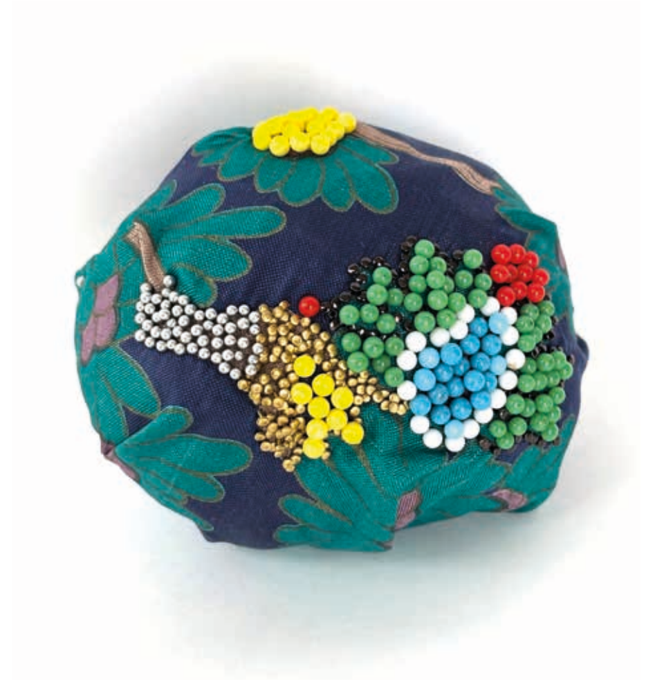
Épingles sur tissu 2026